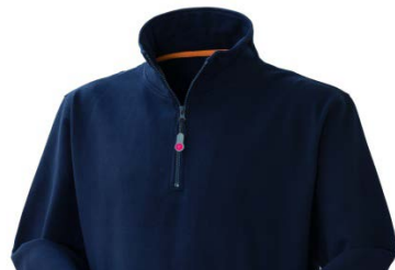
01 – BLU