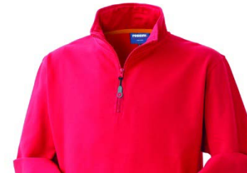
07 – ROSSO