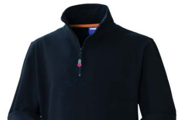
05 – NERO