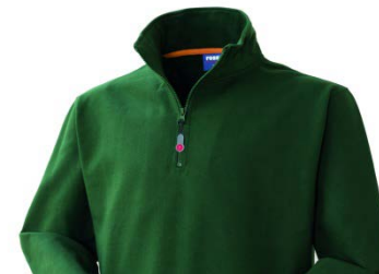
04 – VERDE