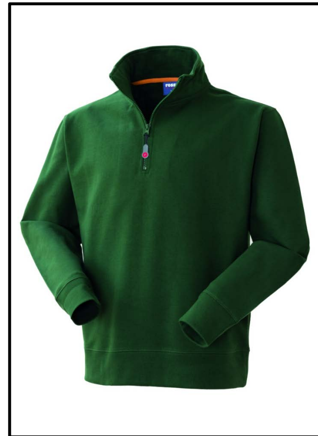
04 – VERDE