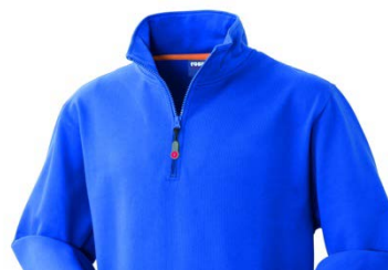
06 – AZZURRO ROYAL