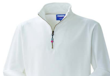
02 – BIANCO