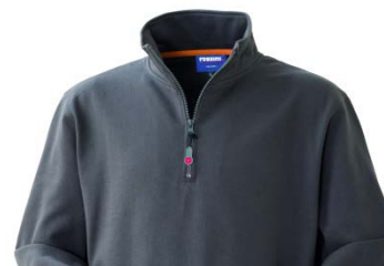
12 – GRIGIO