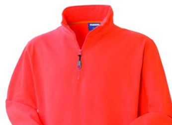
09 – ARANCIO